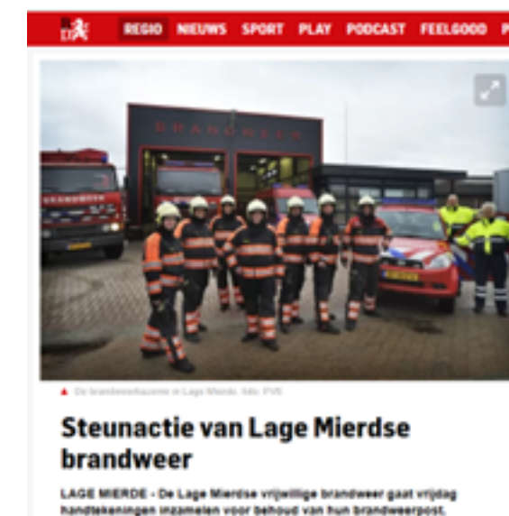
Steunactie van Lage Mierdse brandweer

Door inzichten te bieden die op de behoeften van inwoners aanhaakten de grootste onrust onder inwoners weg kunnen nemen. En de kazerne gesloten.